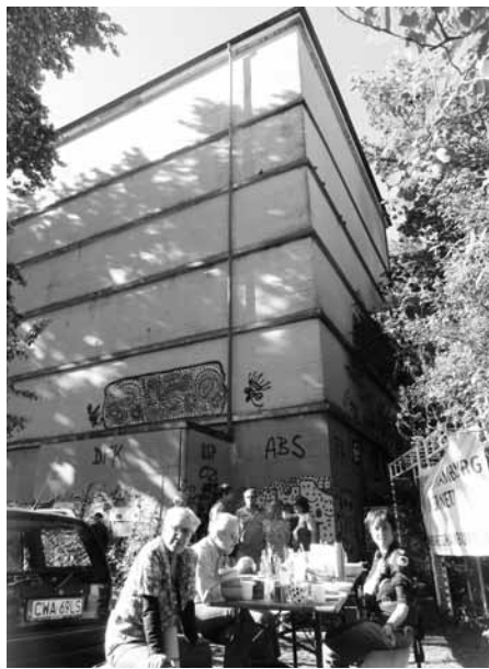
Der Bunker in der Schomburgstraße: Ein zukünftiger Energielieferant?

Bereits 2010 hat Julian Stolte das Projekt auf dem Stadtteilforum im Bürgertreff vorgestellt und gleich neue Mitstreiter gefunden. Und das ist die Idee: 700 Luftschutzbunker aus dem 2. Weltkrieg gibt es in Hamburg. Sie stehen nutzlos in den Wohngebieten, im Inneren nur leere Luft. Durch ihre Lage und ihre Leere sind sie ideal geeignet für die Erzeugung von Nahwärme aus Biomasse.