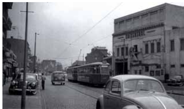
1961 wird aus dem Kino der Tanzpalast "Kaisersaal". Bis 1963 kann man noch mit der Straßenbahn vorfahren

im Westen“. Seine Mauern schlossen direkt an das Kino an. Nach Erinnerungen von Zeitzeugen gab es Verbindungstüren zwischen den beiden Gebäuden. Bei Polizeikontrollen und Razzien vor 1937 konnten Besucher der Häuser so in die jeweils andere Stadt entkommen, wenn sich die Hamburger und Altonaer Polizei nicht vorher abgesprochen hatte.