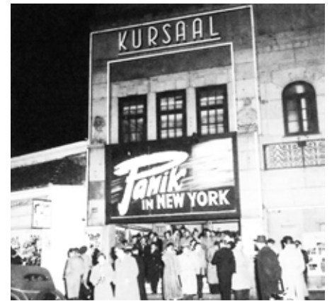
1953: Monsterfilm lockt Kinobesucher

1961 wird aus dem Kino der Tanzpalast „Kaisersaal“. Nun spielen hier Live-Bands und die Hamburger Jugend tanzt dazu im ehemaligen Kinosaal. Der Name soll an das legendäre, im Krieg zerstörte Kaisercafé an der Max-Brauer-Allee erinnern. Auch die Beatles sollen hier, als noch unbekannte „Silver-Beatles“, einmal aufgetreten sein. Doch der Erfolg ist nicht von Dauer, es wird ruhig im Haus.