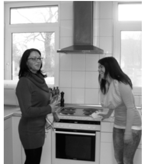
Spaß beim Einsatz in der FLAKS-Küche

Mit Hilfe der "Bufdis" bleibt FLAKS mit seinem gastronomischen Angebot ein