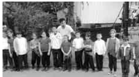
Erster Auftritt bei "Planten un Blomen".