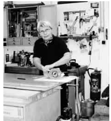
Hier entsteht ein neues Möbelstück.