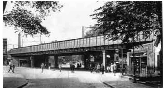
Die modernisierte Sternbrücke von 1925/26.

1925/26 wird die heutige Brücke gebaut. Die alten Brückengewölbe bleiben erhalten und die Reichsbahndirektion lässt die beiden neuen Wiederlager zu Läden ausbauen. Die Klinkerverkleidung der Brückenbögen stammt aus dieser