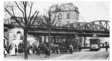
Um 1900: Die Straßenbahn unter der neuen Eisenbahnbrücke.

1893 ist die erste stählerne Sternbrücke fertig. Das Gelände ist reich verziert, in den Brückengewölben eröffnet ein Restaurant, in das Offiziere und Unteroffiziere der nahe gelegenen Kaserne gerne einkehren. In dem Gewölbe an der Stresemannstraße, heute ein Fahrradladen, waren noch lange Reste der alten Wandausmalungen zu sehen.