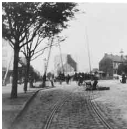
1891: Noch gibt es die Bahnschranken. Im Vordergrund die Schienen der Pferdebahn.

1866 wird die Eisenbahnlinie zwischen Altona und Hamburg eröffnet. Der Stern wird nun siebenzackig. Die erste Bahntrasse der Verbindungsbahn führt fast 30 Jahre lang ebenerdig von Hamburg kommend diagonal auf den Stern zu, quert die Kreuzung, und läuft dann Richtung Viktoria-Kasernen und Holstenbrauerei weiter zum alten Altonaer Hauptbahnhof an der Palmaille. Beschränkte Bahnübergänge regeln die